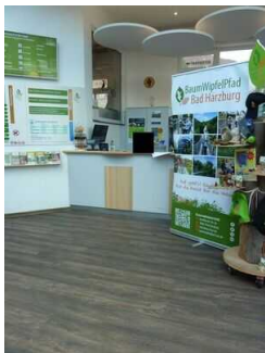
Kasse / Ticketschalter