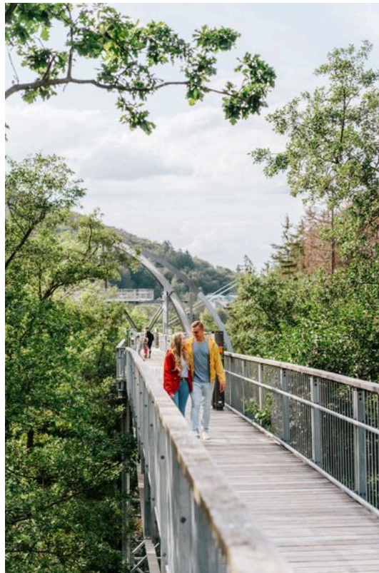
Baumwipfelpfad Harz